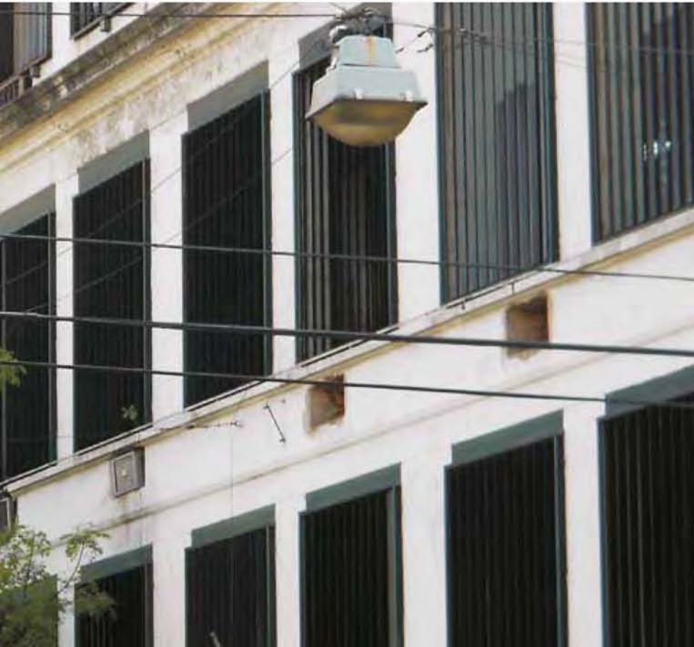
Fotografías en este artículo: Facultad de Filosofía y Letras en el barrio de Caballito, Buenos Aires.

El estudio del tratamiento del tiempo y del espacio en Tirano Banderas y el particular diseño de su estructura pasaron a estar al frente de las preocupaciones de la cátedra en relación con esta novela. Cuando en 1999 se esta-