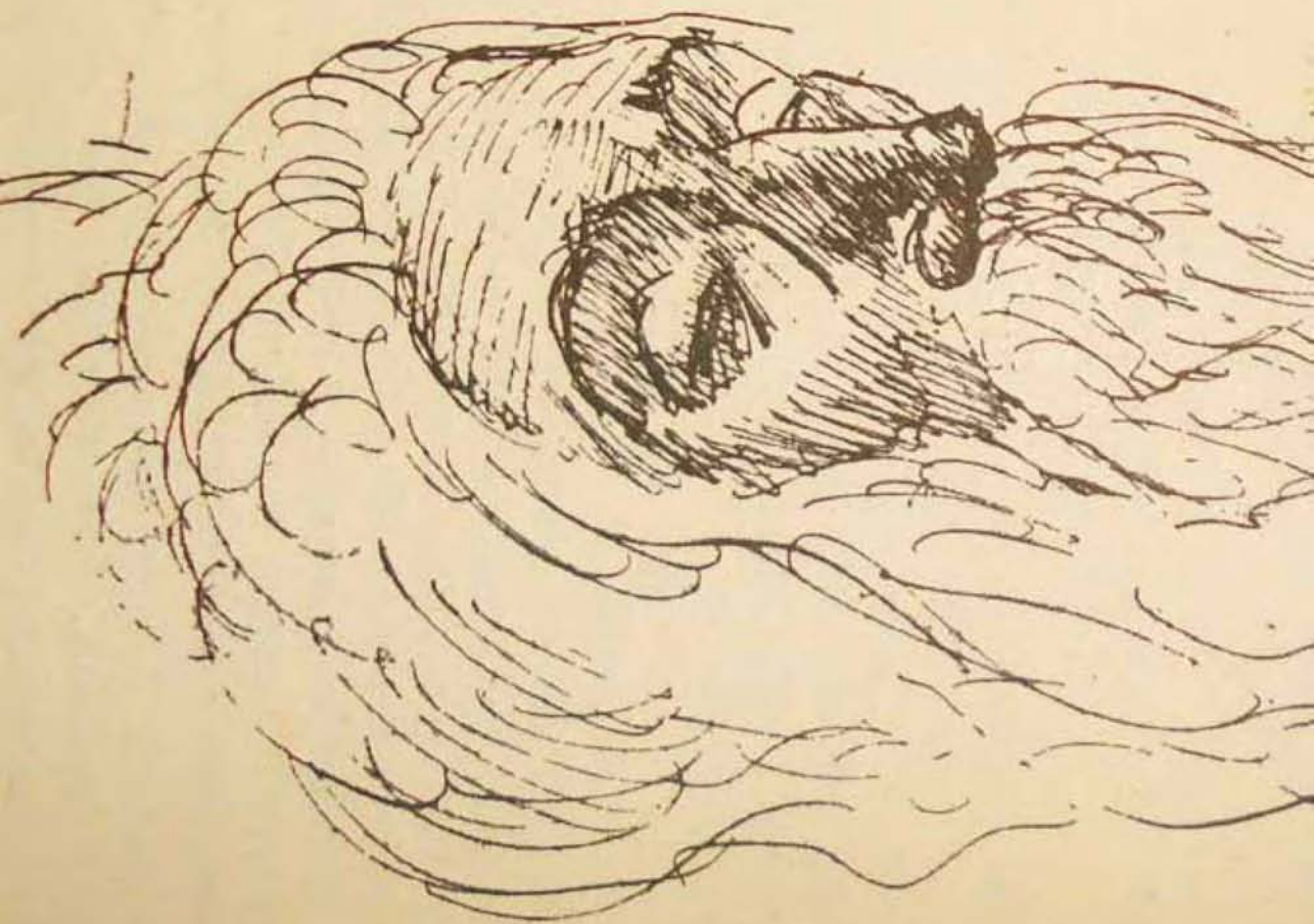
Apunte inédito de la cabeza Valle-Inclán, tomado por Al