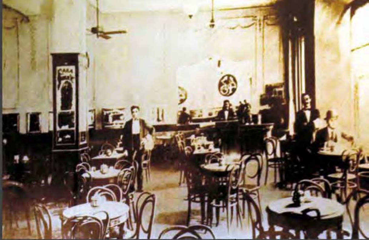
Interior del Café de los Inmortales

apostrofador bíblico; a ratos, un legista romano ; un día, un mago medieval; otro, un virrey en América; con frecuencia, cuando habla de la guerra apologeticamente, un capitán carlista. (Cuando se piensa en la funesta obra del llamado liberalismo español, obra de postración y corrupción nacionales, el carlismo, considerado como actitud de insolidaridad moral con este período de decadencia pública, actitud mucho más altiva y sincera que la del republicanismo histórico, comienza a inspirarnos respeto). (Araquistain, Nosotros , 136, vol. 36, 1920)