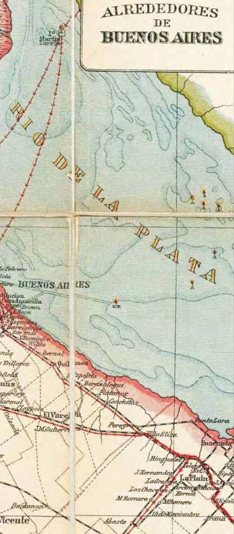
Nuevo mapa de la República Argentina, 1914. (Detalle)