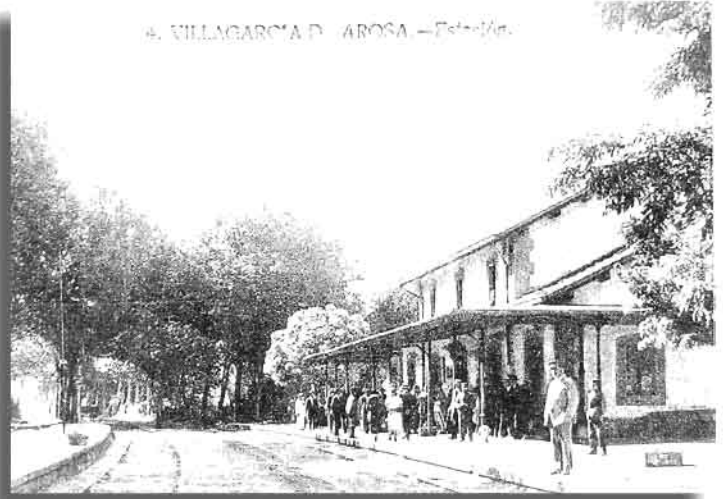
4. VILLAGARCÍA DE ROSA. —Estación—

Finalmente a mediados de agosto de 1873 finalizaron las obras del ferrocarril y en septiembre fue inaugurada la línea. El número de pasajeros y el volumen de mercancías transportadas fue aumentando lentamente: en el año 1883 la cifra de viajeros alcanzaba