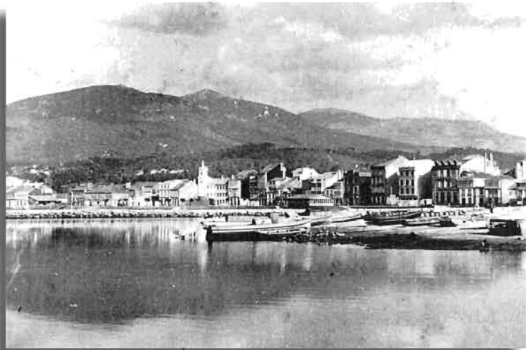
Avenida da Mariña.