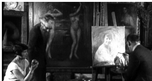
Estudio del pintor Romero de Torres