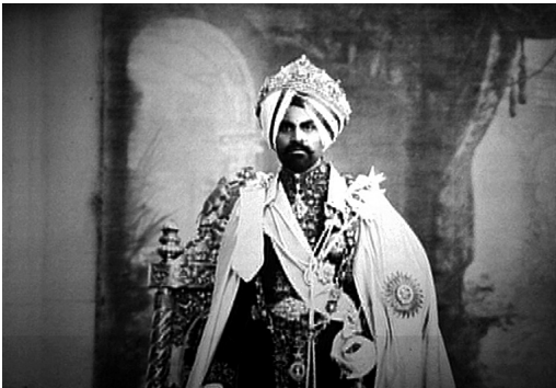
El Maharajá de Kapurthala

Jagatjit Singh había viajado a Madrid formando parte de la delegación británica que asistió a la boda del rey Alfonso XIII con la princesa Victoria Eugenia de Battenberg. El Maharajá era un personaje muy conocido en París y Londres, donde su fama de hombre riquísimo era legendaria. Había accedido al trono del pequeño principado de Kapurthala, en el Punjab, con tan sólo 5 años y cuando visitó Madrid tenía 34. De joven había sido bastante rollizo, pero después adelgazó y se convirtió en un conquistador que subyugaba a las damas con su apostura, su