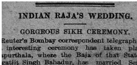
Noticia de la boda