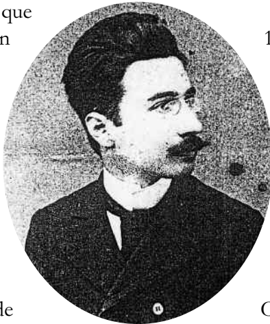
Valle-Inclán en 1892

Valle-Inclán ingresara catro anos antes, o curso 1884-1885, na Universidade de Santiago, onde cursaba a carreira de Dereito. Os seus anos universitarios coinciden, por tanto, coa xestación e desenvolvemento do rexionalismo, movemento liderado polo amigo de seu pai, Manuel Murguía e polo seu profesor Alfredo Brañas 54 . Non é extraño, pois, que en sintonía co tempo e ambiente que o rodea, se mova e participe, ao igual que seu irmán maior Carlos, en círculos literarios e xornalísti-