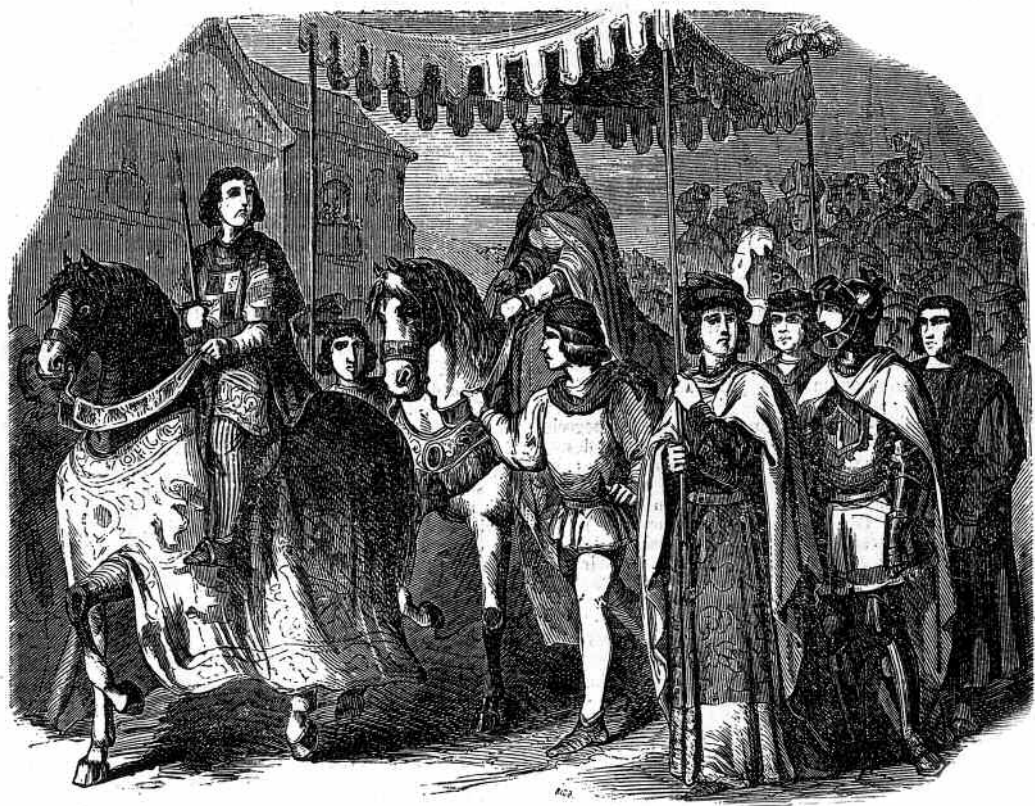
Proclamación de Isabel la Católica

Sagunto, Numancia, o reino visigodo ou a Reconquista, mais na que cómpre destacar tamén «la exaltación de los Reyes Católicos, sobre todo de Isabel de Castilla, por estimarlos artífices de la unidad nacional» e «la guerra de los comuneros castellanos como representativa de la tradición castellana de libertades públicas frente a la autocracia de Carlos V y, en general, la idea de castellanismo como vértebra de la nación española.».