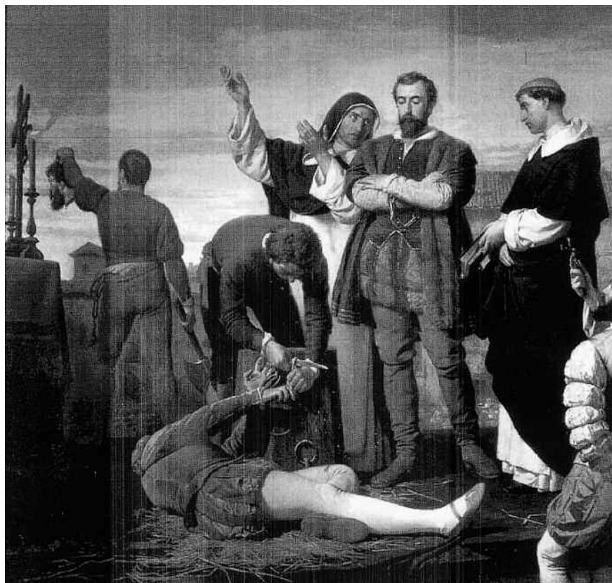
Antonio Gisbert: Los Comuneros de Castilla (1860)

Nesta obra, «compendio de la historiografía krausista y castellanófila que nos ayuda a ubicar y circunscribir las ideas fundamentales en la creación de una cultura nacional castellanófila», Altamira considera transcendental no devir histórico de España, «la sublevación de las Comunidades de Castilla». Por iso, «estudia en detalle y con amplia documentación el descontento de los comuneros con el Rey, la formación de la Junta, su programa político con la referencia al poder de las Comunidades y a su constitución con cierta autonomía», e a continuación «analiza los actos políticos de la Junta, las vicisitudes del movimiento municipal, la con-